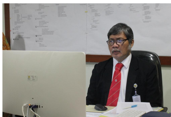
(Dekan FK UPNVJ)

Secara teknis pelaksanaannya, dekan beserta jajarannya melakukan secara online di Gedung dr. Wahidin UPNVJ dan para peserta lainnya mengikuti pembacaan sumpah via zoom meeting.